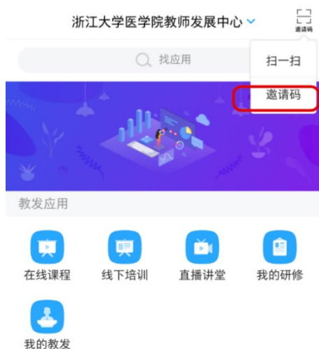
步骤 1 输入邀请码