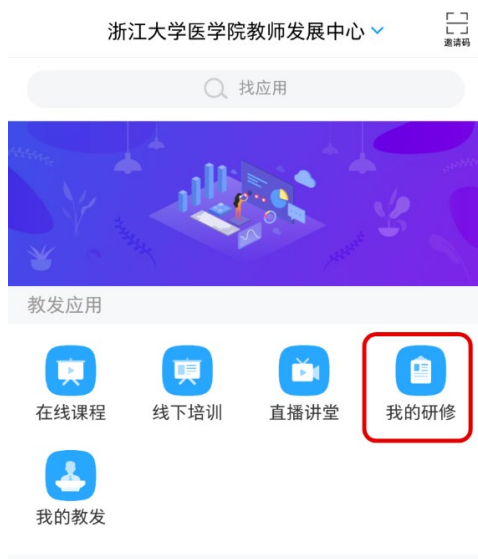
步骤 2 选择我的研修