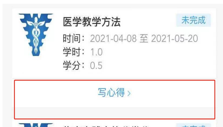
步骤 4 学习结束写心得