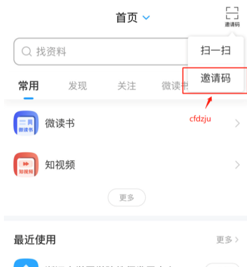
步骤 1 输入邀请码 cfdzju